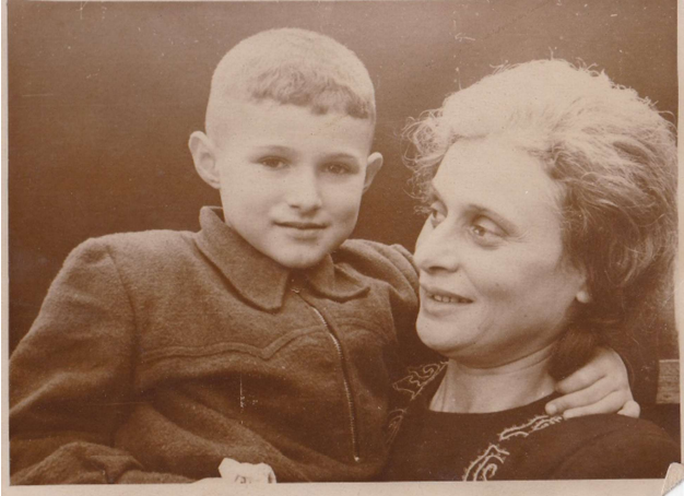
Я с мамой