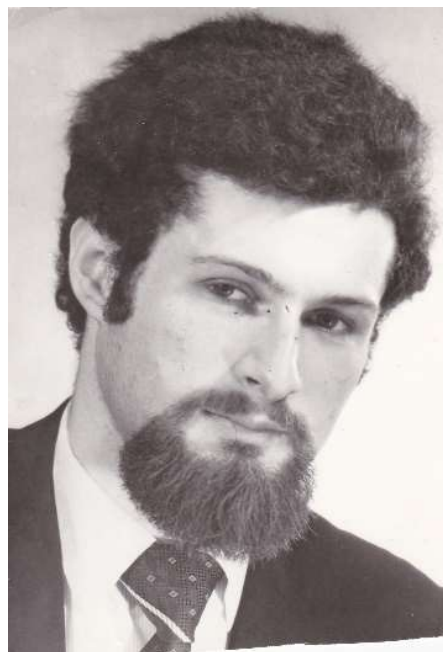
Мне 27 лет