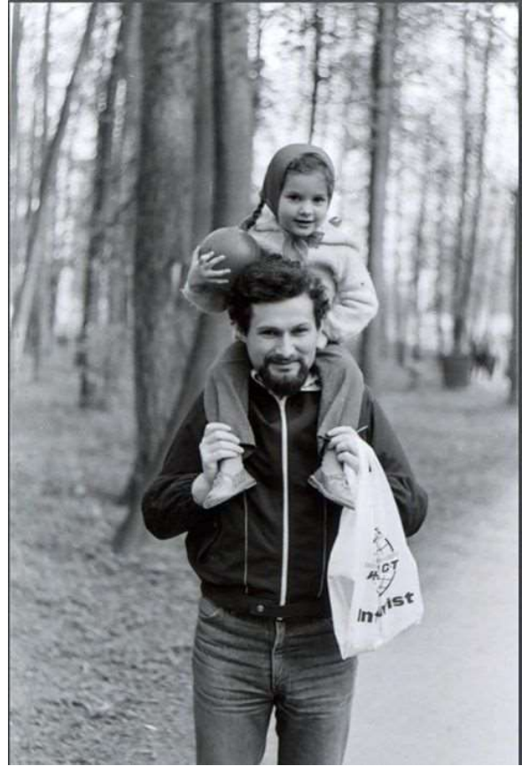
В Филевском парке с Женечкой

Еще в студенческие годы я начал собирать и записывать песни 20-х годов - своего рода фольклор. И, когда укладывал Женечку спать, пел ей с большим старанием. Советские песни я не любил и не пел. И вот однажды зимой мы ехали в переполненном троллейбусе мимо Большого театра. Я держал её на руках, стоя на задней площадке. Естественно, никто не уступил мне место. Это было обычное дело для Москвы: мест было мало и на всех не хватало, сидел сильнейший. И в какой-то момент Женечка запела тоненьким голоском одну из моих песен: «Когда фонарики качаются ночные и все на улицу боятся выходить, я из пивной иду, я никого не жду, я никого уж не сумею полюбить...» Троллейбус оживился: все, очевидно, решили, что я только что вернулся с зоны (тюрьмы) и пожалели ребёнка, у которого такой отец. Женечке стали приносить конфеты, гладить её и смотрели на меня с явным осуждением. Нам пришлось сойти на следующей остановке.