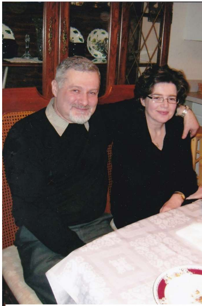
Мичиган. Я с женой

дизайнера оформят на работу, и потребовал, чтобы я закончил работу через неделю. Всё было ясно. На следующий день появился дизайнер, который не знал наших правил, да и пришёл он на несколько дней. У меня было большое желание врезать этому человеку из Германии, но тогда было бы не миновать тюрьмы. Я попросил дизайнера чем-нибудь заполнить 20 листов и дал ему для этого старые чертежи. Позвонил на завод, объяснил ситуацию и попросил подписать эту ерунду. Они согласились, понимая, что происходит - мы проработали вместе не один год. В пятницу я поехал в Каламазу и подписал все 20 листов. Инженеры завода пожелали мне удачи, хотя никто в неё не верил в данном случае. В понедельник я отдал чертежи немцу, но он их даже не смотрел. В четверг меня вызвал мой начальник и долго говорил мне, что он меня очень уважает и счастлив работать со мной. Он хотел показать мне, что не имеет никакого отношения к тому, что происходит. В пятницу, за 15 минут до окончания рабочего дня, он вызвал меня (там уже