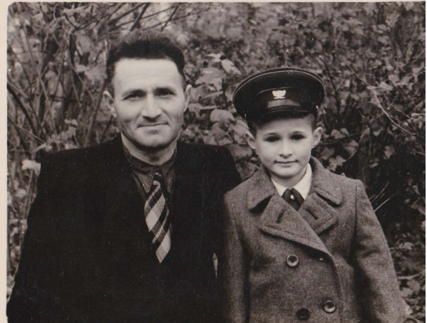
Я с папой

Вот в этих условиях я и появился. Меня очень ждали, потому что ребёнок придавал этой жуткой жизни какой-то смысл. Я чувствовал, да и сейчас чувствую эту безграничную любовь моих родителей, хотя их давно уже нет в живых.