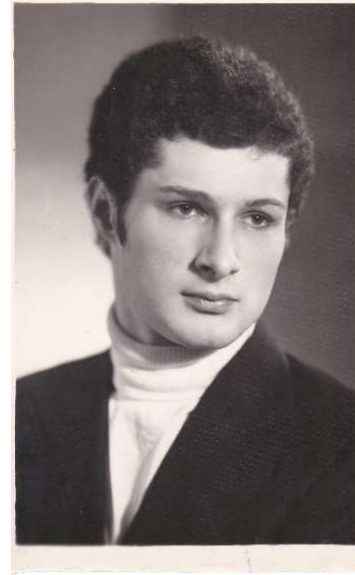
Мне 22 года

После приезда мы поели и легли спать. День был очень тяжёлый и полный впечатлений. Ночью я почувствовал некоторое неудобство. Как будто все тело чешется. Не выдержал, встал и включил свет - в кровати было до тридцати каких-то жучков. Некоторые из них ползли по потолку, а затем падали в кровать. Я не понимал, что происходит, и разбудил брата, он сказал,