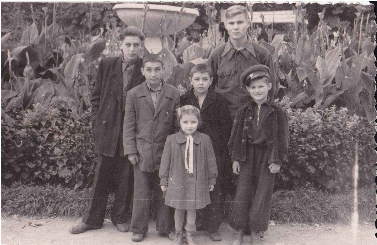
Наша дворовая команда (я крайний справа)

Себя я помню с 5 лет. Мама мыла пол в нашей маленькой комнате, а по радио сообщили о смерти товарища Сталина. Мама заплакала, а мне было всё равно: я ещё не успел полюбить Великого вождя пролетариата товарища Сталина.