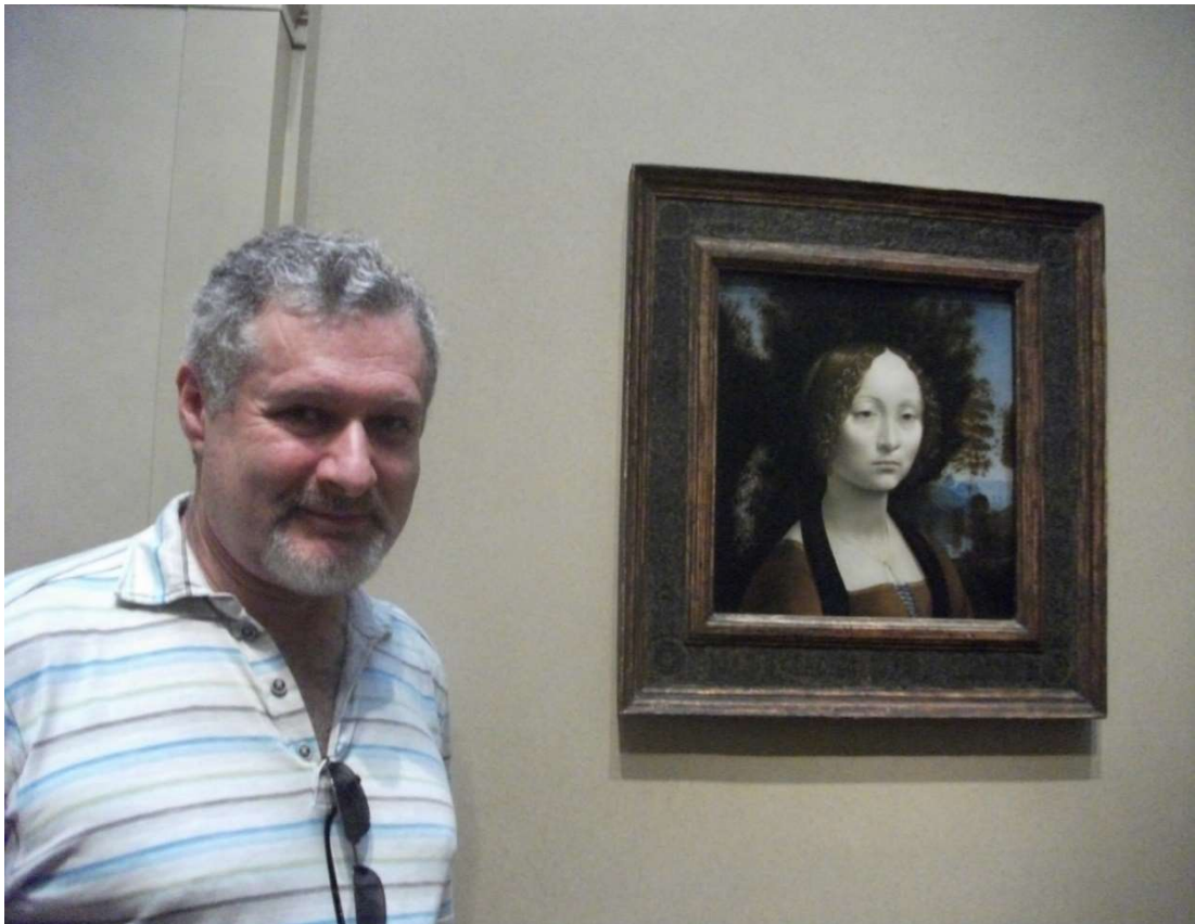
Портрет Джиневры ди Бенчи кисти Леонардо да Винчи (Я слева)

После Италии на следующий год мы поехали в Париж и сразу пошли в Лувр смотреть «Джоконду» да Винчи, с которой я уже был немножко знаком. Нашу незабываемую встречу я описывал в 5-й главе этих очерков. Мне хотелось побольше пообщаться с известным произведением. Увы, результат был тот же. Нет-нет, я ничего не пил и вёл себя прилично, но вокруг портрета было человек триста и добраться до него было невозможно. Да и на этот раз пуленепробиваемое стекло отражало лампы освещения, и наш контакт опять не состоялся - обидно.