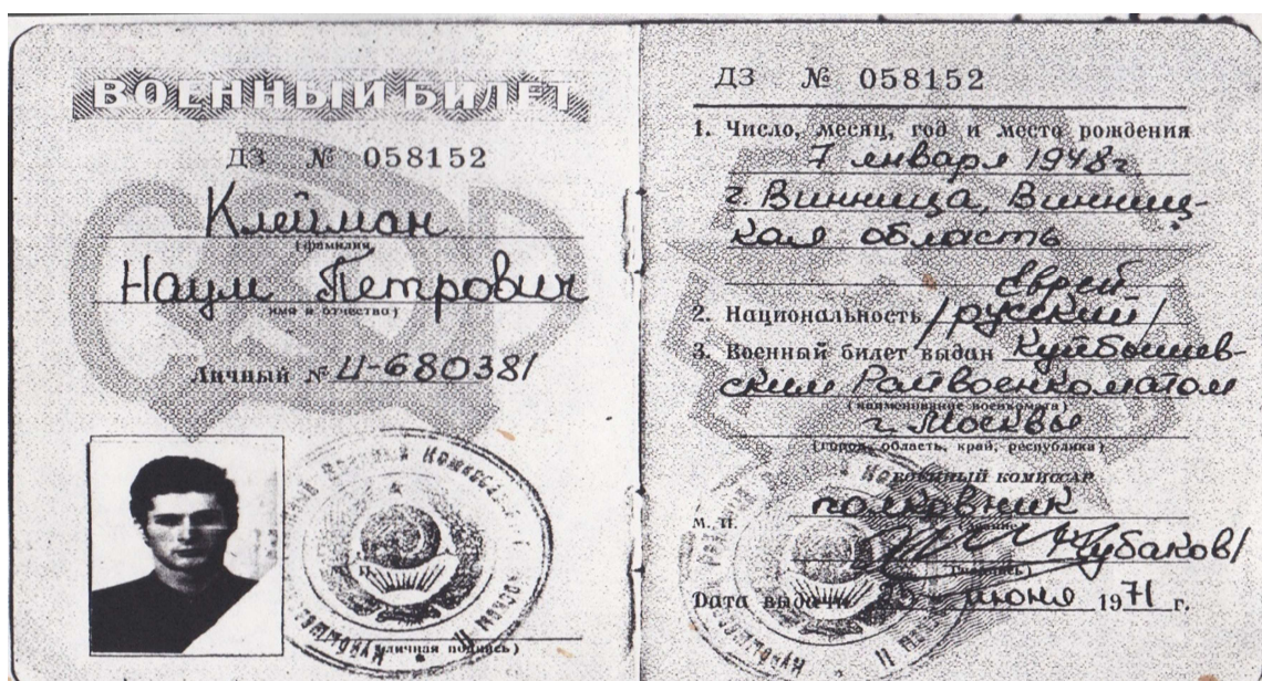
Мой военный билет

Уникальное событие произошло со мной. Перед окончанием института, в Куйбышевском военкомате Москвы мне выдали военный билет офицера. Я его внимательно рассмотрел только в общежитии и нашёл страшную ошибку: в графе «национальность» было написано «русский». Я немедленно поехал в военкомат к военкому и указал ему на это. К моему удивлению, он проявил жуткую беспечность и спросил меня, мешает ли это мне в жизни. Услышав неопределённый ответ, он извинился, и, сославшись на занятость, ушёл. Так я и остался по военному билету русским. Я и забыл об этом. Прошло много лет, я уже был женат, и однажды получаю повестку явиться срочно в военкомат Киевского района города Москвы. Ничего хорошего от военкомата в своей жизни я не получал и любви к нему не испытывал, но